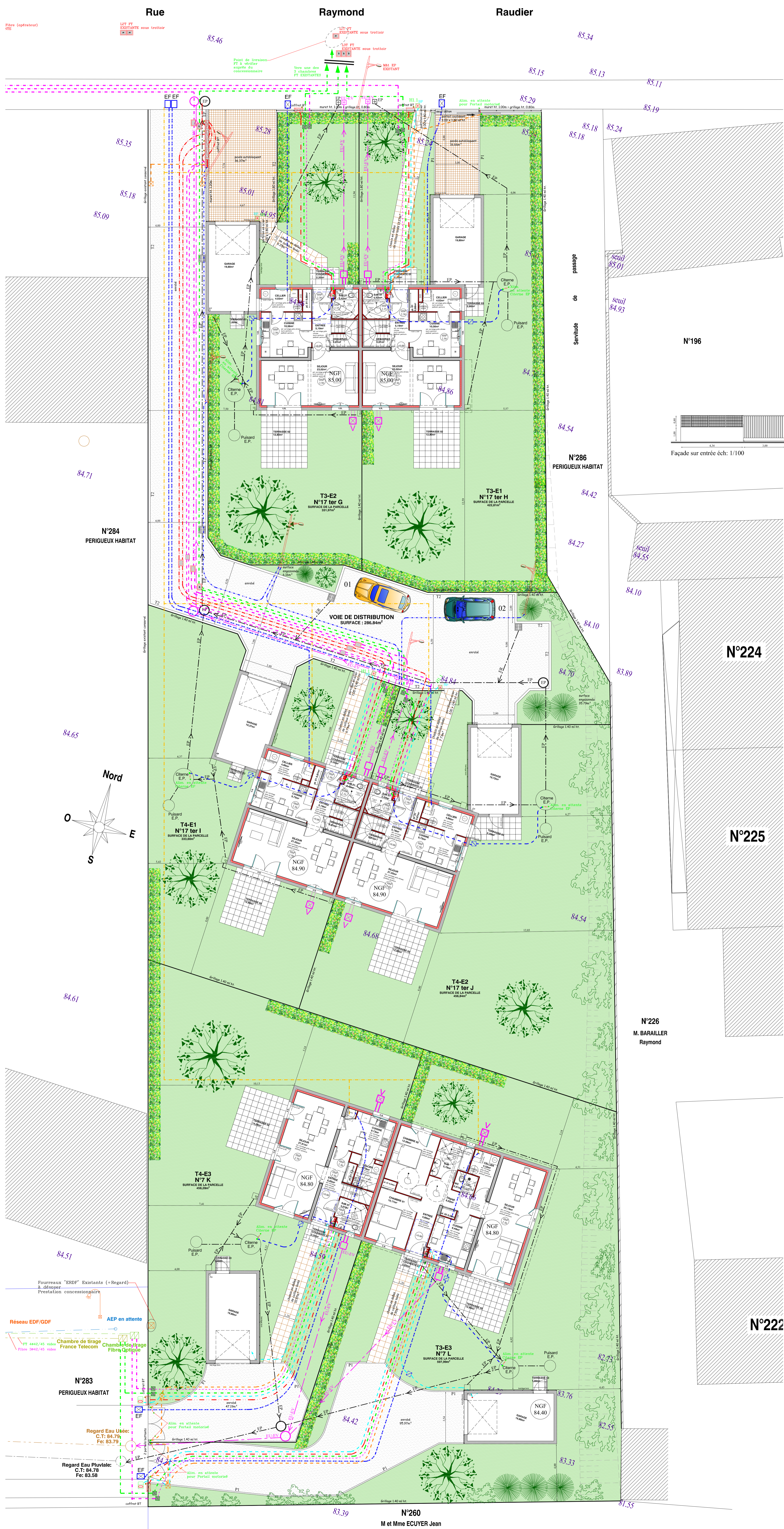
Plan de masse Est éch: 1/100